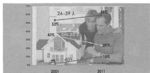
Quelle: Andrea Baidinger, Trendstudie "Wohnen" 2011 Repräsentative Umfrage Sample: 1000 ÖsterreicherInnen

andrea. baidinger kommunikation bauen wohnen immobilien