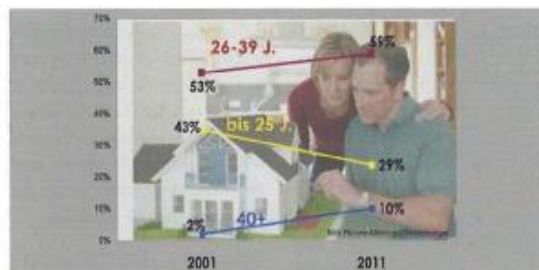
Trendstudie „Wohnen“ 2011 Repräsentative Umfrage Sample 1.000 ÖsterreicherInnen

die Immobilie im Grundbuch zu 50 %. Im Falle einer Trennung wird zu etwa einem Viertel das Haus oder die Wohnung zum unerfreulichen Streitfall. Haben 2001 auf die Frage „Würden Sie nochmals mit Ihrem/einem Partner eine Eigentumsimmobilie erwerben?“ 29 % mit „Nein“ geantwortet, so würden aktuell bereits 44 % diesen Vorgang nicht mehr wiederholen. „Wir sehen im langjährigen Zyklus die Veränderungen. Der Rückgang beim Wunsch nach einem Einfamili-